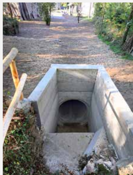
Lavori di somma urgenza Loc. Fontana