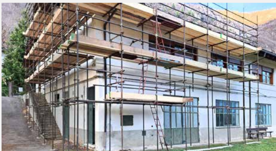
Realizzazione nuovo asilo nido nella ex scuola dei Casetti