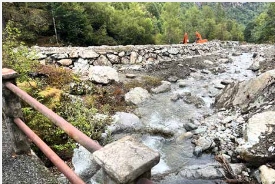
Regimazione acque località San Giacomo