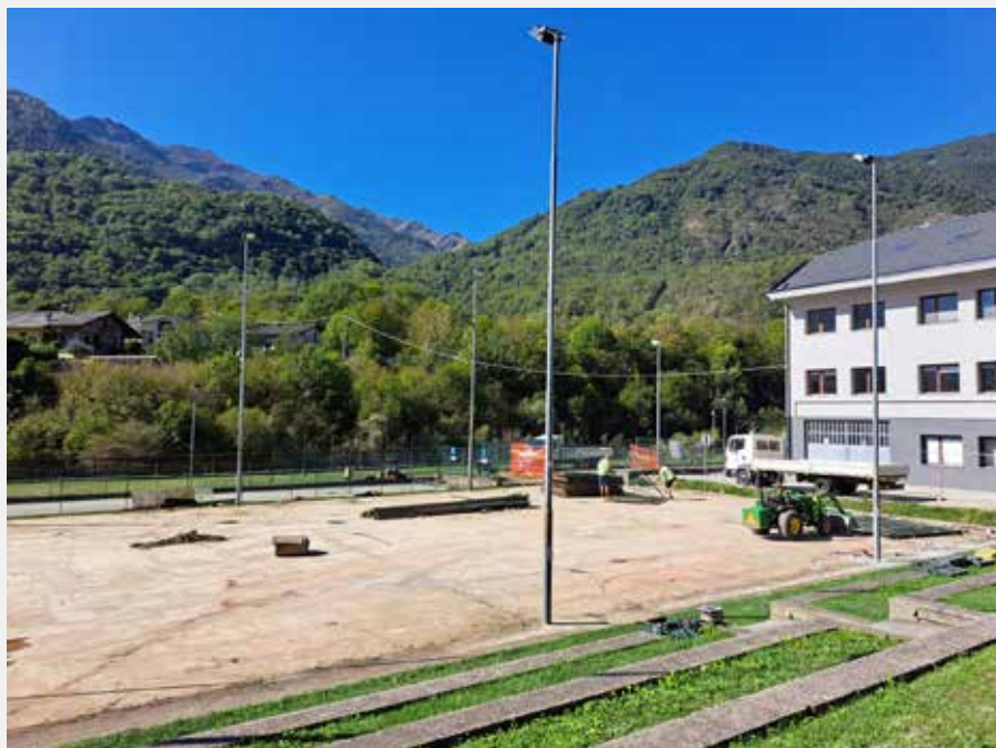
Rifacimento e copertura campo da tennis