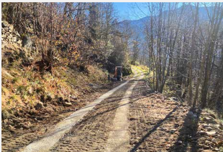
Sistemazione pista forestale Loc. Trucca