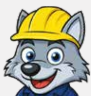
Asfaltature varie su strade comunali