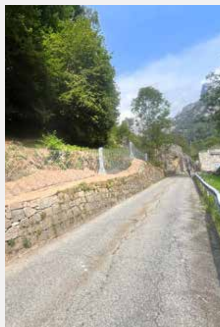
Opera di difesa caduta massi in località Buriat