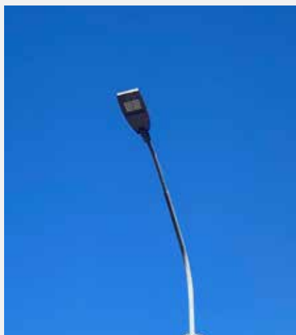
Efficientamento illuminazione pubblica