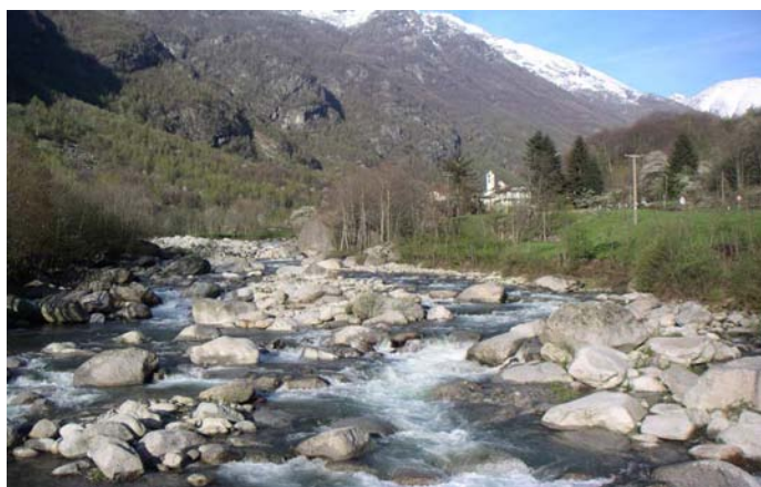
Salmo Trutta Trota Fario